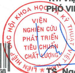
TS. Ngô Tất Thắng